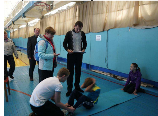
Сборная команда гимназии

17 октября команда наша команда поедет в ФОК «Молодежный», где будет бороться за звание сильнейшей команды Орехово-Зуевского района. Пожелаем удачи нашим спортсменам.